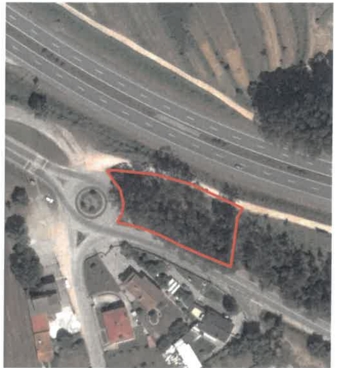
Rotunda do Fontão / "Fina Flor"