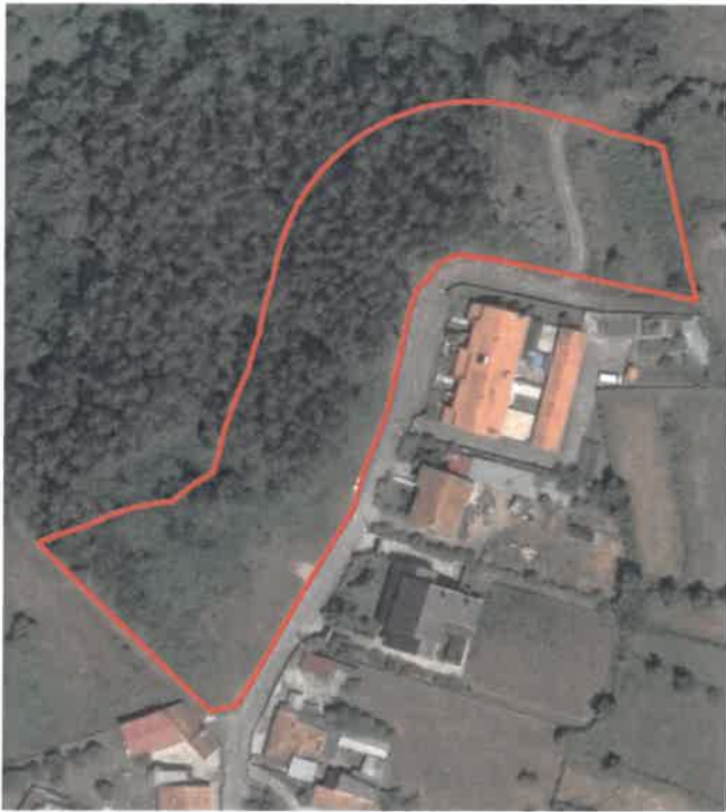
Travessa Cova da Raposa