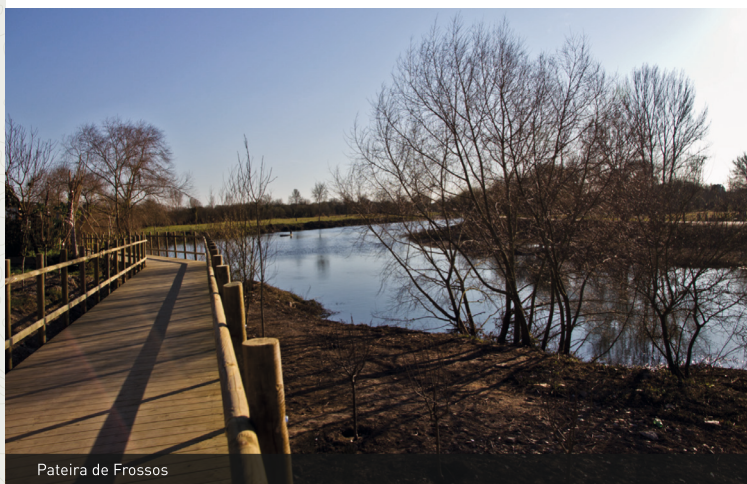
Pateira de Frossos